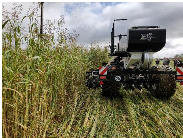
Semis du couvert en relais, photo prise le 25/09/2019.

Objectifs : principalement agronomiques pour augmenter la matière organique du sol, ne pas bouleverser la vie du sol, limiter l'usage de produit phytosanitaire et lutter contre l'érosion.