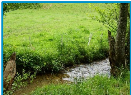
Quantité et qualité de l'eau