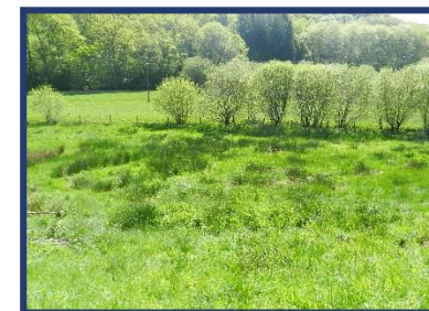
Stockage de carbone