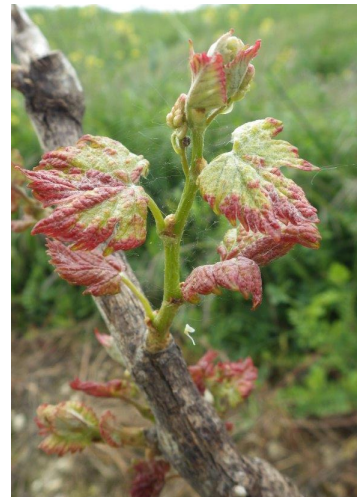
Erinose : dégâts précoce sur Muscadelle

Les femelles hivernent dans les écailles des bourgeons et colonisent très tôt les jeunes feuilles pour se nourrir et pondre. Très rapidement après le débourrement démarre une phase de reproduction de l'acarien au cours de laquelle seront produites les populations d'adultes des premières générations estivales qui vont migrer vers le bourgeon terminal et les nouvelles feuilles des rameaux. Cette migration démarre fin mai et s'intensifie après la floraison.