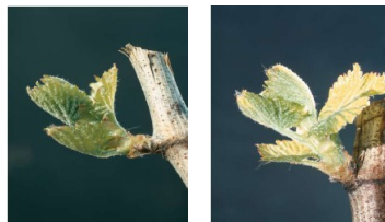
Rappel des stades de sensibilité de la vigne aux contaminations par l'excorisoe = stade 6 (sortie des feuilles) à stade 9 (premières feuilles étalées)

Les attaques apparaissent au printemps, sur les jeunes rameaux, peu après le débourrement, et se manifestent par des taches brun-noir parfois d'aspect liégeux à la hauteur des premiers entre-nœuds.