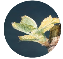
Stade 9 : Premières feuilles