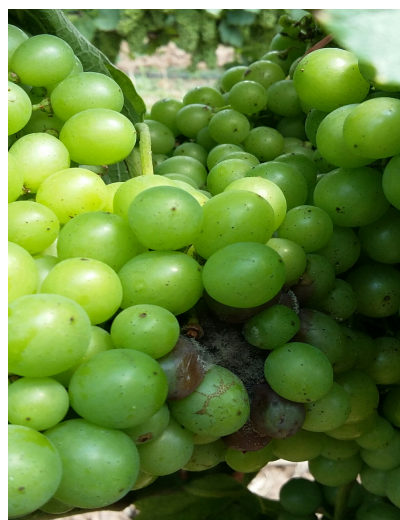
Foyer de Botrytis sur Gamay (CA81)