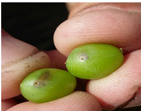
Perforation d'eudémis en G2 (CA81)

Le vol d'Eulia est terminé. Quelques dégâts sur baies ont été observés de manière plus ou moins sporadique.