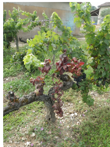
Symptômes de Flavescence sur cépage rouge (CA81)