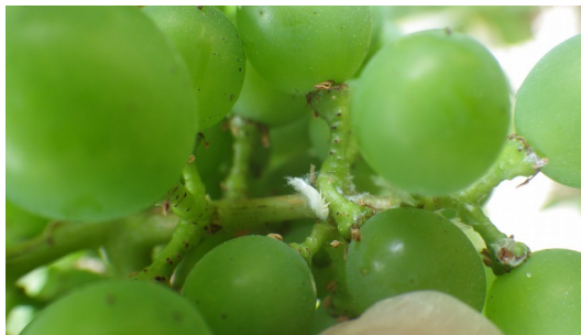
« Coton » et larve de Metcalfa pruinosa observés sur grappes (CA81)

Le prochain BSV Vigne Gaillac paraîtra le mardi 24 juillet 2018