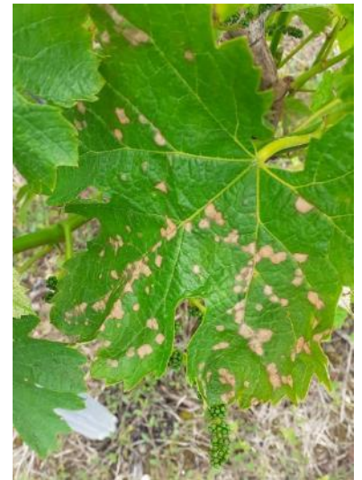
Black-rot sur témoin non traité

A ce jour, aucune pluie n'est annoncée, mais surveillez les prévisions météo