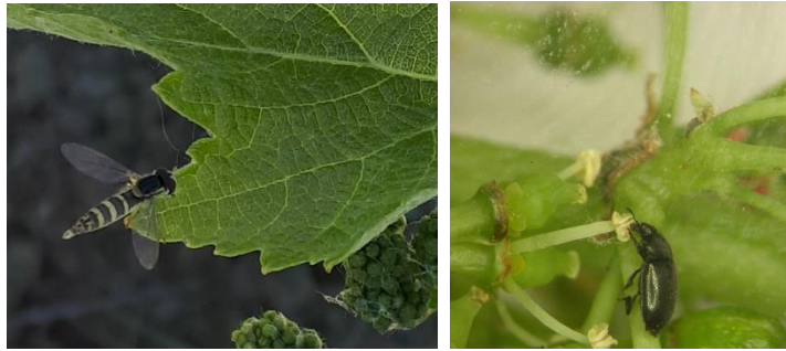
A gauche : Syrphe en vol ; A droite : Mélégèthe

Comme chaque année à la floraison, on peut observer des méligèthes sur les grappes.