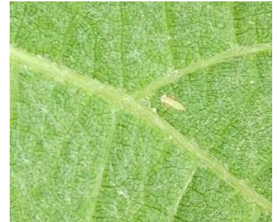
Larve de cicadelle verte

Mesures prophylactiques : L'application d'argile comme barrière physique est à mettre en place avant l'installation significative des populations.