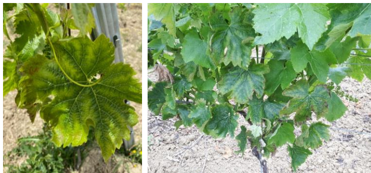
Carences en potasse

Des symptômes de chlorose et de carences en potasse sont visibles sur les parcelles.