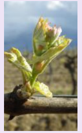
stade E ou 9

Stratégie à 2 applications : 1 application au stade « sortie des feuilles » (stade D), 1 application au stade « 2-3 feuilles étalées » (stade E). Attention, il faut tenir compte du stade des bourgeons de la base : 50% des bourgeons doivent avoir atteint le stade visé.