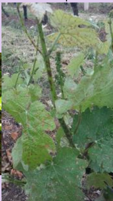
Phytotoxicité de spotlight