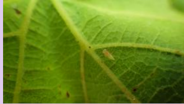
Larve de cicadelle verte

Ce sont les larves qui sont à l'origine des dégâts de grillure.