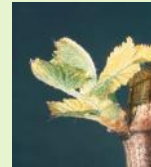
2 feuilles étalées - IFV