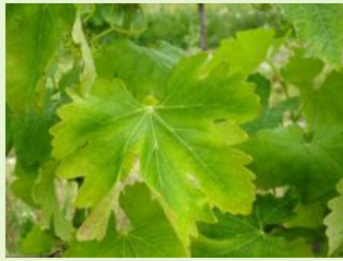
Carence en potasse

Carences: des symptômes de carence en potasse et chlorose ferrique sont toujours visibles sur le vignoble.