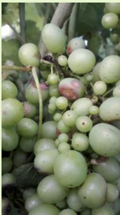
Black-rot, sur grappes.

La période de sensibilité maximale des grappes se poursuit jusqu'au stade "fermeture de la grappe". Toutefois sur les parcelles atteintes protégez jusqu'à "véraison". En toutes situations, soyez couverts avant les dégradations orageuses.