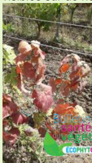
Flavescence dorée sur fer Servadou, juin 2020

Les populations sont en baisse. Des larves L2 et L3 sont présentes au vignoble, elles sont préférentiellement observées sur les pampres. Des symptômes sont visibles sur de nombreux secteurs.