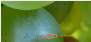
Oeuf de vers de la grappe

(Avec confusion sexuelle: 5 à 10 inflorescences avec au moins un glomérule pour 100 inflorescences).