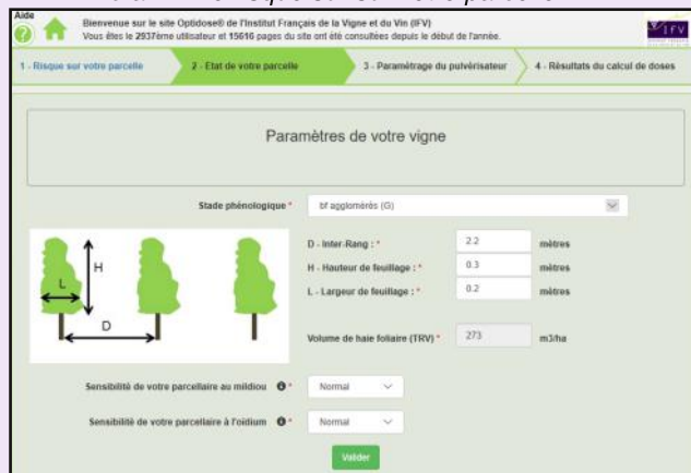
Ecran 2: Etat de votre parcelle