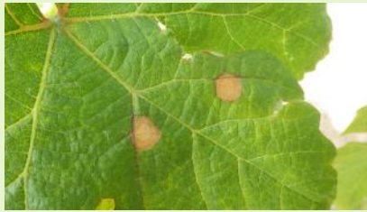
Taches de black-rot sur feuilles

Surveillez l'apparition des taches, suite aux pluies contaminantes survenues sur le mois d'avril.