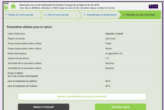
Ecran 4: Résultats du calcul de doses

https://www.vignevin-epicure.com/index.php/fre/optidose2/optidose