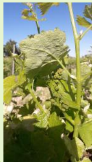
Boutons "floraux agglomérés" Mauzac

On note un avance d'environ 3 semaines par rapport à l'année dernière.