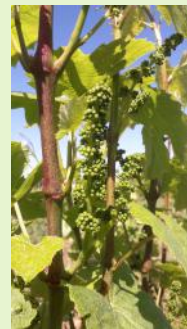
Boutons "floraux séparés" Gamay