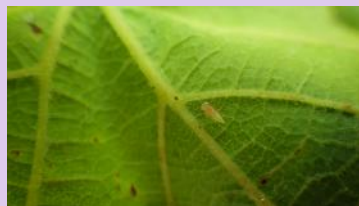
Larve de cicadelle verte

Ce sont les larves qui sont à l'origine des dégâts de grillure. La gestion du ravageur repose sur une surveillance des populations larvaires.