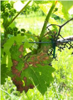
Taches de black-rot sur feuilles, en présence de baies momifiées

Des contaminations ont eu lieu au cours des pluies du 10 au 14 mai. Les taches issues des pluies contaminantes de la semaine dernière sont en incubation et devrait sortir d'ici 15 jours.