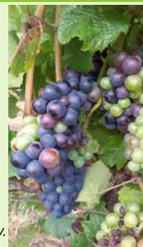
"mi-véraison" sur Gamay.

Les rameaux post-gel sont au stade "fermeture de la grappe à premiers grains vérés".