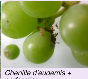
Chenille d'eudemis + perforation.

Le seuil de nuisibilité est fixé à 5% de grappes présentant au moins un glomérule ou une perforation. Si le seuil de 5% est dépassé, alors un traitement insecticide est préconisé sur les œufs de la génération suivante.