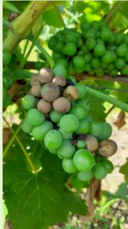
Black-rot sur grappe.

La véraison annonce la fin de la sensibilité des grappes.