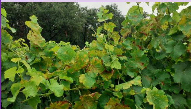
Mildiou sur l'extrémité des rameaux.

Des nouvelles sorties de taches sont observées sur le haut du feuillage, les symptômes ont peu évolué sur grappes.