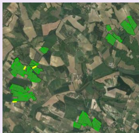
Exemple de carte avec les points (verts et jaunes) à contrôler.

Les parcelles faisant l'objet des contrôles sont cartographiées et les comptages sont effectués sur des points prédéterminés. Les points à contrôler sont généralement situés en bordure de parcelle ou d'îlot.