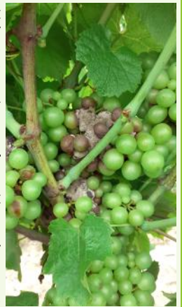
Foyer de botrytis sur Gamay.

L'effeuillage, favorise l'aération des grappes et permet d'éviter que l'humidité ne reste au niveau des baies. Il doit être réalisé côté soleil levant pour éviter les risques de brûlures.