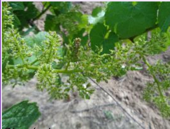
Glomérules sur inflorescence.

- Sur la deuxième et la troisième génération, le contrôle porte sur le nombre de grappes présentant au moins une perforation. La période d'observation optimum est lorsque les larves sont entre les stades L3 et L5.