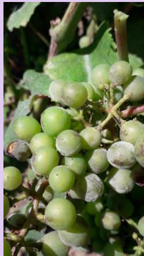
Oïdium sur grappe.