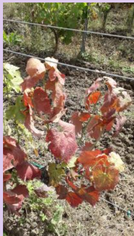
Symptômes de flavescence dorée

Les larves observées au vignoble sont essentiellement des L3. Des symptômes sont signalés