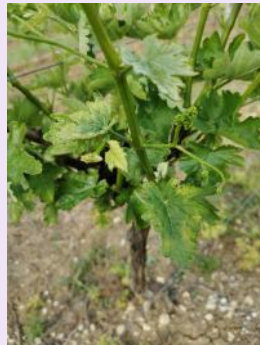
Carence en potasse.

Erinose: Des symptômes sont présents sur les jeunes feuilles.