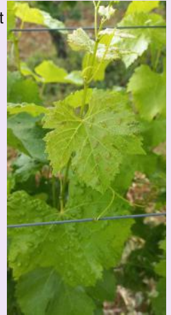
Erinose sur jeunes feuilles

Erinose: Des symptômes sont présents sur les jeunes feuilles.