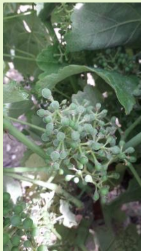
Oïdium sur grappe

Les conditions actuelles sont très favorables, des contaminations sont possibles.