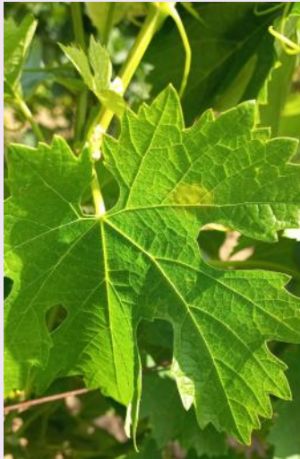
Mildiou sur feuille

Des taches isolées sont signalées sur un témoin non traité et au vignoble. Les symptômes observés sont rares et de faible intensité, ils seraient issus des contaminations pré-épidémiques du 8 juin. A ce jour, le vignoble est sain.