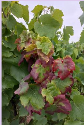
Flavescence dorée sur cépage rouge

Des symptômes sont visibles sur les parcelles.