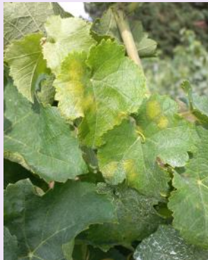
Mildiou sur jeunes feuilles

La période de sensibilité des baies est terminée. Il est toutefois important de préserver l'état sanitaire du feuillage jusqu'aux vendanges.