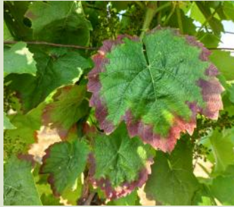
Grillures sur Merlot

La gestion du ravageur repose sur une surveillance des populations larvaires, ce sont les larves qui engendrent les grillures. Il est important de garder un feuillage fonctionnel jusqu'à la récolte.