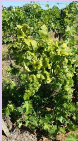
Flavescence dorée sur cépage blanc