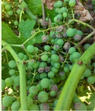
Black-rot sur baies