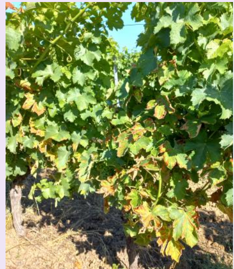
Esca sur Sauvignon, forme lente

De nombreux symptômes sont observés, ils peuvent être sous forme lente ou apoplectique.