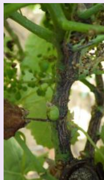
Symptômes en été.

La première sera réalisée au stade « sortie des feuilles » (stade D) et la deuxième application au stade « 2-3 feuilles étalées » (stade E). Attention, il faut tenir compte du stade des bourgeons de la base : 50% des bourgeons doivent avoir atteint le stade visé.