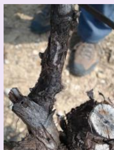
Symptômes en hiver.