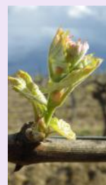
Stade E ou 9.