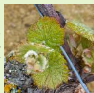
"Trois feuilles étalées"

Les différents stades observés cette semaine s'échelonnent de "pointe verte" pour les situations les plus tardives de Mauzac et Fer servadou à "3 à 4 feuilles étalées" pour les situations les plus précoces de Gamay, Loin de l'oeil et Fer servadou. Plus généralement, le stade observé est de "2 à 3 feuilles étalées".