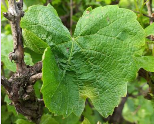
Mildiou sur feuille

Aucun nouveau symptôme n'a été signalé sur le vignoble.