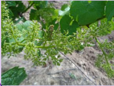
Glomérules sur inflorescence.

La floraison est enclenchée sur la majorité des parcelles, prévoir un dénombrement des glomérules la semaine prochaine. Il permet d'évaluer le niveau de pression de la G1.