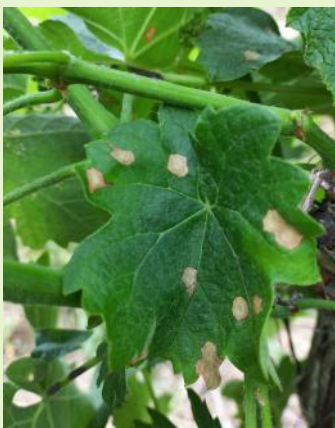
Taches de black-rot sur feuille

Quelques taches récentes sur feuilles ont été ponctuellement observées la semaine dernière. Cette sortie de taches de faible ampleur est à relier aux pluies très localisées du 3 mai.