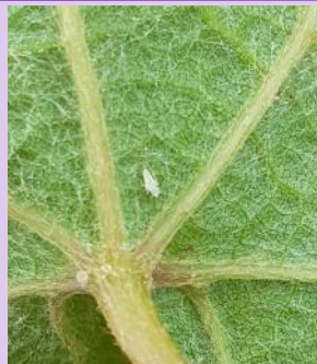
Larve L1 de cicadelle de la flavescence dorée

Des larves au stade L1 et L2 sont observées sur le vignoble.