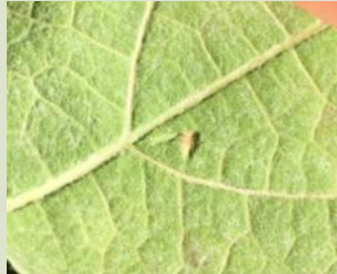
Larves de cicadelle verte

Ce sont les larves qui sont à l'origine des dégâts de grillure. La gestion du ravageur repose sur une surveillance des populations larvaires.