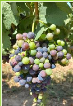
"Mi-véraison", Duras, (Ph CA81)

La véraison est enclenchée dans la majorité des situations. Fer servadou, Merlot : de "premiers grains vérés" à "début véraison". Gamay, Chardonnay, Loin de l'oeil : de "début véraison" à "75 % véraison". Duras, Syrah : de "premiers grains vérés" à "mi-véraison". Mauzac : de "fermeture de la grappe" à "premiers grains vérés". La véraison progresse lentement, et peut être très hétérogène au sein d'une même parcelle.