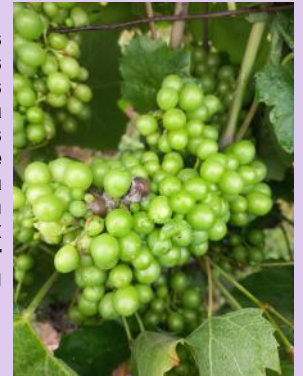
Botrytis sur grappe de Gamay.