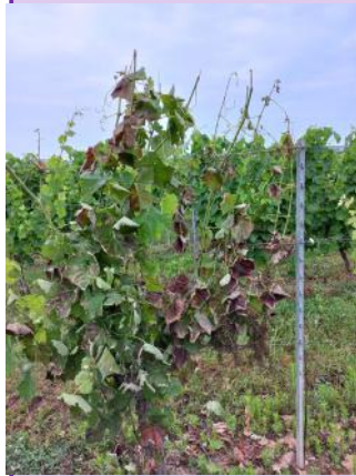
Apoplexie, Fer servadou.

Les symptômes d'apoplexie sont très présents, tous les cépages sont touchés.