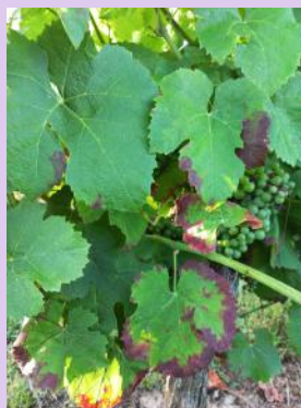
Symptômes de grillures, Fer servadou

Ce sont les larves qui sont à l'origine des dégâts de grillure. La gestion du ravageur repose sur une surveillance des populations larvaires.