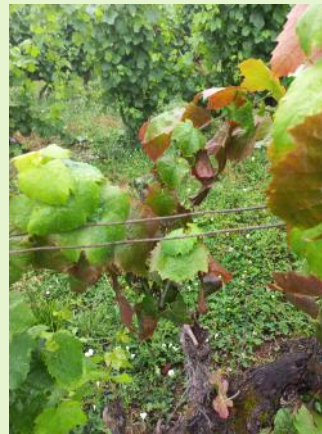
Flavescence dorée sur Gamay

A ce jour la période des applications est terminée en agriculture biologique. Surveillez vos parcelles et coupez les pieds qui présentent des symptômes.