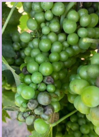
Mildiou, rot-brun sur une grappe de Gamay, (Ph : CA81)

La véraison annonce la fin de la sensibilité des grappes, néanmoins le feuillage reste fortement impacté. Il faut continuer à protéger les nouvelles pousses afin de conserver un feuillage fonctionnel jusqu'aux vendanges, pour la maturité mais aussi la mise en réserve.