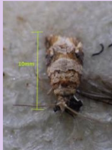
Eudémis, papillon, (Ph: CA81)

Le dénombrement des perforations en fin de G2 montre une pression plus élevée qu'en G1, notamment sur les parcelles non confusées. Un niveau de pression élevée est signalé sur les secteurs de Tecou, Lagrave, Sainte Cécile du Cayrou et Gaillac.