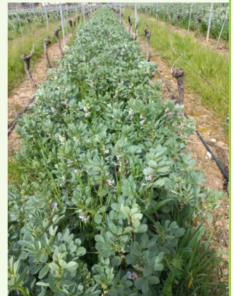
Féveroles au stade optimum pour la destruction.

Destruction des couverts : (voir VIGIVITI et VIGIVITI BIO n°1, 4 avril 2023)