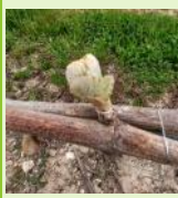
Sortie des feuilles

Les différents stades observés cette semaine s'échelonnent de "bourgeon dans le coton" pour les situations les plus tardives de Mauzac à "3 à 4 feuilles étalées" pour les situations les plus précoces de Gamay et Loin de l'oeil. Le stade le plus fréquemment observé est "sortie des feuilles".