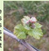
2 à 3 feuilles étalées

Les différents stades observés cette semaine s'échelonnent de "bourgeon dans le coton" pour les situations les plus tardives de Mauzac à "3 à 4 feuilles étalées" pour les situations les plus précoces de Gamay et Loin de l'oeil. Le stade le plus fréquemment observé est "sortie des feuilles".