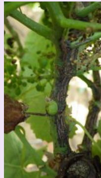
Symptômes en été.