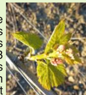
3 feuilles étalées/grappes visibles

Les différents stades observés cette semaine s'échelonnent de "sortie des feuilles" pour les situations les plus tardives de Mauzac, Fer servadou et Syrah à "3 feuilles étalées/grappes visibles" pour les situations les plus précoces de Gamay, Loin de l'oeil et Chardonnay. Les stades sont globalement hétérogènes, les bouts de baguette sont plus avancés.