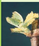
1er feuille étalée-IFV

Les différents stades observés cette semaine s'échelonnent de "sortie des feuilles" pour les situations les plus tardives de Mauzac, Fer servadou et Syrah à "3 feuilles étalées/grappes visibles" pour les situations les plus précoces de Gamay, Loin de l'oeil et Chardonnay. Les stades sont globalement hétérogènes, les bouts de baguette sont plus avancés.