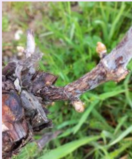
Symptômes en hiver.