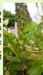
Boutons floraux séparés Loin de l'oeil

La majorité des parcelles se situent entre le stade "boutons floraux agglomérés" et boutons floraux séparés". Les parcelles les plus tardives de Mauzac, Syrah et Loin de l'oeil sont au stade "boutons floraux agglomérés" et les plus précoces de Gamay, Loin de l'oeil, Fer servadou, Duras et Merlot sont au stade "boutons floraux séparés".