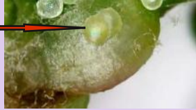
Pontes d'eudemis sur inflorescence

Eudemis : les captures se poursuivent mais sont très peu nombreuses. Des éclosions ont été observées.