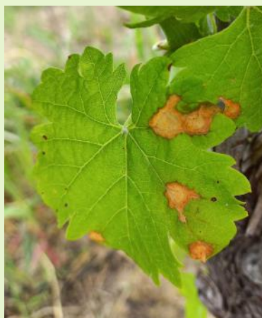
Black-rot sur feuille sur un témoin non traité à Brens

Les produits à base de soufre ne sont pas homologués mais ont une efficacité secondaire démontrée à 8 kg/ha (biocontrôle).