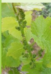
Boutons floraux séparés Fer servadou

La majorité des parcelles se situent entre le stade "boutons floraux agglomérés" et boutons floraux séparés". Les parcelles les plus tardives de Mauzac, Syrah et Loin de l'oeil sont au stade "boutons floraux agglomérés" et les plus précoces de Gamay, Loin de l'oeil, Fer servadou, Duras et Merlot sont au stade "boutons floraux séparés".