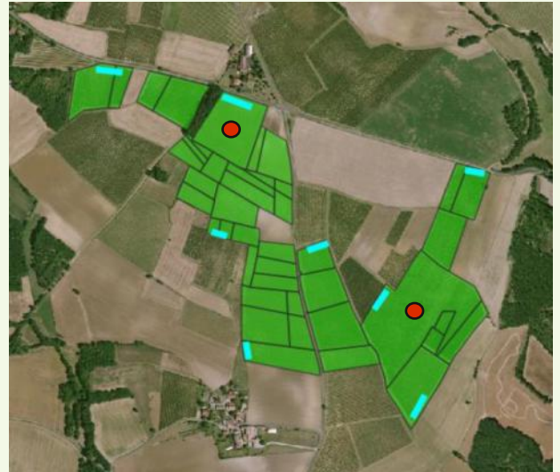
Ci-dessus, l'exemple d'un îlot de parcelles confusées, les tirets verts matérialisent les points de comptage sur les bordures. Les points rouges représentent les comptages réalisés au centre des parcelles, quand le seuil de nuisibilité a été dépassé sur la bordure.

Les bordures de parcelles ou d'îlots constituent généralement les points faibles de la confusion, ils peuvent être le point de départ d'une infestation. Un premier comptage doit être réalisé en priorité en bordure de parcelle. Si le seuil est dépassé, un deuxième comptage réalisé au centre de la parcelle, vous aidera à estimer le niveau de gravité de l'attaque.