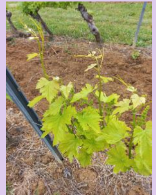
Chlorose ferrique sur Loin de l'oeil.

Des symptômes de carence en potasse et chlorose ferrique sont visibles sur le vignoble.