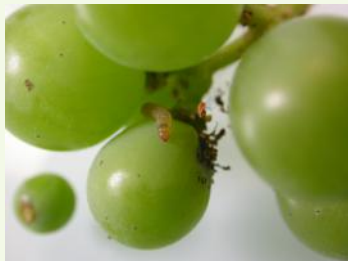
Chenille d'eudemis + perforation.

- Sur la deuxième génération, le contrôle consiste à dénombrer les grappes portant au moins une perforation. Le comptage porte sur un échantillon de 25 grappes, le seuil est dépassé à partir de 2 grappes attaquées. L'observation est réalisée lorsque les larves sont âgées (entre le stade L3 et L5), les dégâts sont alors plus faciles à repérer.