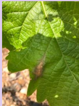
Botrytis sur feuille

Quelques feuilles présentent des symptômes de botrytis. Ils n'ont aucune incidence sur les attaques qui pourraient avoir lieu lors de la récolte.