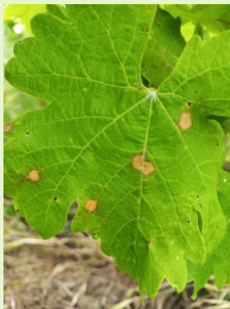
Black-rot sur feuille

Les produits à base de soufre ne sont pas homologués mais ont une efficacité secondaire démontrée à 8 kg/ha ( biocontrôle ).