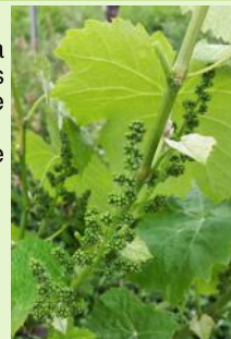
"Boutons floraux séparés" Fer servadou

Le stade "boutons floraux séparés" est atteint dans la majorité des situations. Quelques parcelles plus tardives de Mauzac et de Fer servadou sont encore au stade "boutons floraux agglomérés". Cette semaine il y a peu d'évolution, la pousse a été lente.