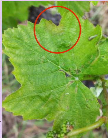
Mildiou sur feuille

Ailleurs, des contaminations pré-épidémiques sont modélisées avec un cumul de 20mm.