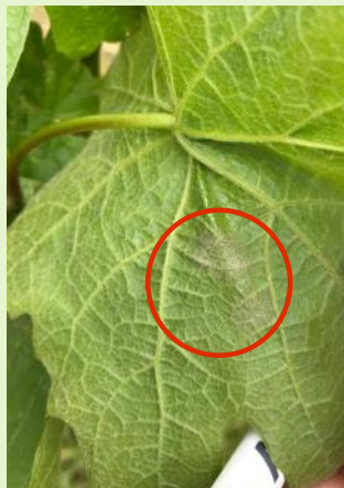
Oïdium sur feuille

Des contaminations sont maintenant possibles, sur l'ensemble des parcelles.