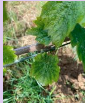
Carence en potasse sur Gamay.