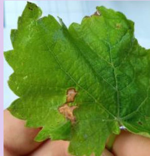
Blessures liées à des frotements