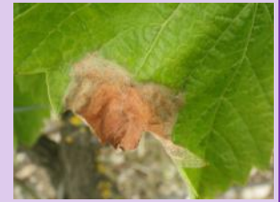
Botrytis sur feuilles

Suite aux conditions humides de ces derniers jours, des taches sur feuilles sont présentes sur le vignoble. Ces symptômes n'ont aucun lien avec les attaques qui pourraient avoir lieu sur grappes lors des vendanges.