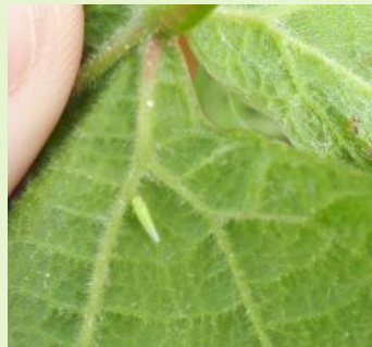
Adulte de cicadelle verte

A ce jour, le risque est nul. La gestion du ravageur repose sur une surveillance des populations larvaires. Le seuil d'intervention est de 100 larves pour 100 feuilles.