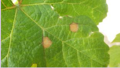
Taches de black-rot

attention à ne pas confondre des symptômes de blessures avec des taches de Black-rot.