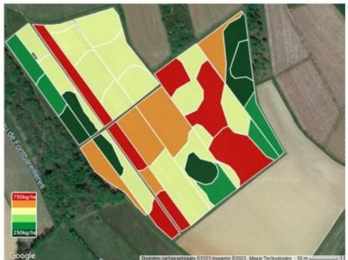
Exemple de carte de modulation de la fertilisation.