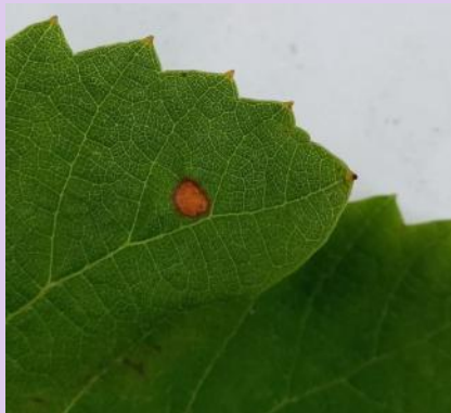
Black-rot sur feuille

La toute première tache de black-rot a été observée sur Fer-servadou.