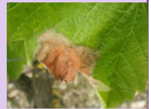
Botrytis sur feuilles

Suite aux conditions humides les symptômes sur feuilles sont très présents sur le vignoble. Ces symptômes n'ont aucun lien avec les attaques qui pourraient avoir lieu sur grappes lors des vendanges.