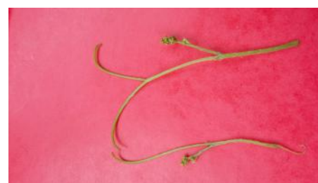
Photos de filage