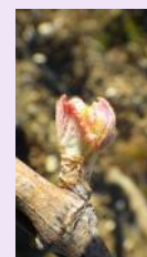
stade D ou 6

Intervenez sur les parcelles sensibles, lorsque c'est possible, avant les pluies contaminantes.