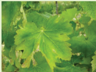
Carence en potasse

Carences: des symptômes de carence en potasse et chlorose ferrique sont observés sur le vignoble.