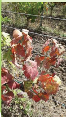
Flavescence dorée sur Fer servadou, juin 2020

Des larves L2 et L3 sont observées au vignoble, elles se trouvent préférentiellement sur les pampres. Les populations sont en baisse. Les premiers symptômes sont visibles au vignoble.