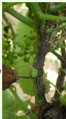
Excoriose sur rameau .

Excoriose: Quelques symptômes sont signalés sur le vignoble.