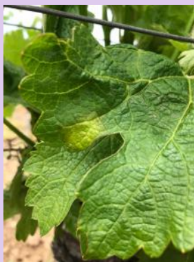
Mildiou sur feuille.

Des contaminations épidémiques ont été modélisées le 11 juin sur les secteurs de Cestayrols, Senouillac et Le Verdier. Elles ont pu être fortes, en particulier sur le secteur du Verdier (46 mm). Sur les secteurs de Gaillac, Rabastens, Cadalen et Cunac, le niveau des précipitations a été insuffisant pour engendrer des contaminations épidémiques. En tous secteurs, un cumul de 3 mm est suffisant pour déclencher la modélisation de contaminations épidémiques. Les symptômes issus des contaminations du 4 et 11 juin devraient être visibles autour du 16 et 21 juin.