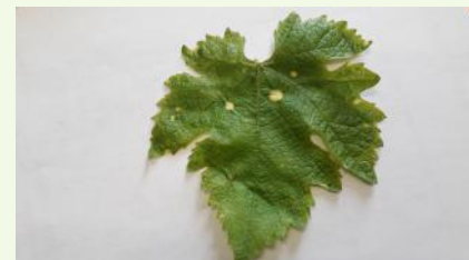
Phytotoxicité d'herbicide grandes cultures

Phytotoxicité d'herbicide: Des symptômes de phytotoxicité en lien avec des traitements herbicides appliqués sur les cultures voisines peuvent être observés sur les parcelles.