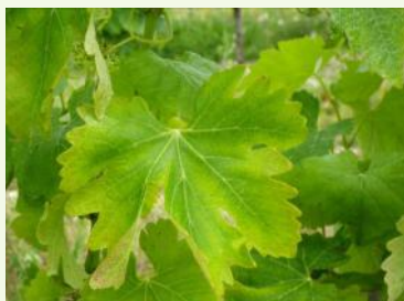
Carence en potasse.

Phytotoxicité d'herbicide: Des symptômes de phytotoxicité en lien avec des traitements herbicides appliqués sur les cultures voisines peuvent être observés sur les parcelles.