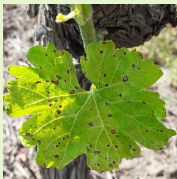
Phytotoxicité de Spotlight