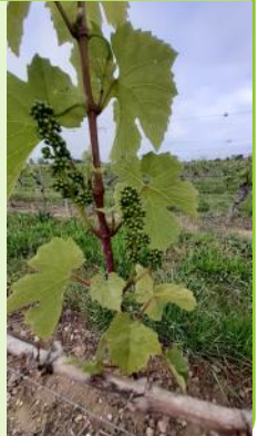
Boutons floraux séparés Gamay.

Les rameaux post-gel sont au stade "4 à 5 feuilles étalées, grappes visibles".