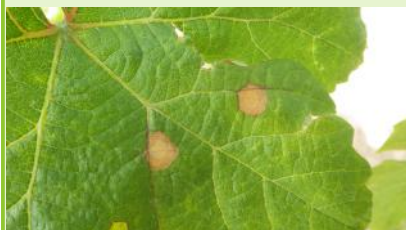
Taches de black-rot sur feuilles

Les symptômes, des contaminations qui ont pu se produire au cours des fréquentes pluies du mois de mai pourraient être visibles dans les jours qui viennent.