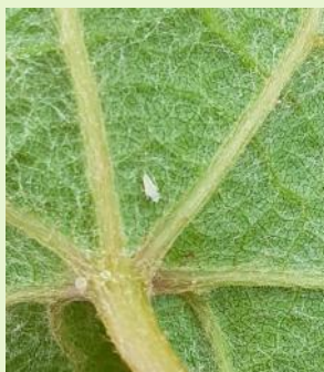
Larve L1 de cicadelle de la flavescence dorée

Des larves (L1) sont observées au vignoble depuis le 10 mai.