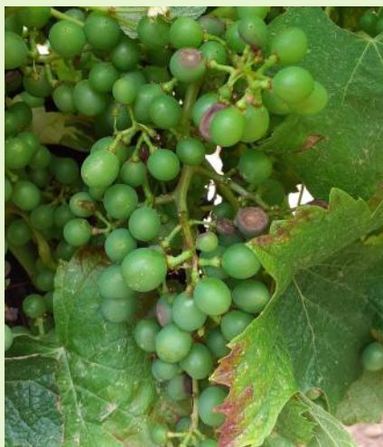
Black-rot sur baies

Les produits à base de soufre ne sont pas homologués mais ont une efficacité secondaire démontrée à 8 kg/ha (Biocontrôle).