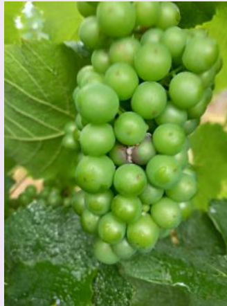
Botrytis sur grappe, Gamay

Mettre en oeuvre la prophylaxie : maîtriser la vigueur, aérer les grappes, effeuiller et gérer le risque vers de la grappe et oïdium. L'effeuillage, favorise l'aération des grappes et permet d'éviter que l'humidité ne reste au niveau des baies. Il doit être réalisé côté soleil levant pour éviter les risques de brûlures.