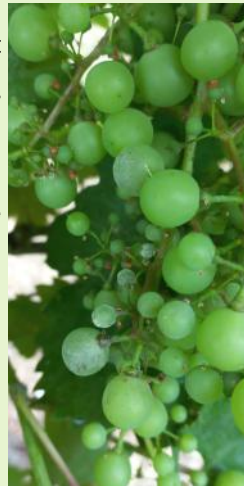
Oidium sur grappe, Muscadelle

Cette semaine les symptômes sont plus présents sur les témoins non traités et sur les parcelles sensibles de Gamay, Chardonnay, Merlot, Duras, Muscadelle et Syrah.