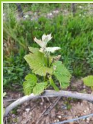
"Boutons floraux agglomérés" Fer servadou

Le stade "4 à 5 feuilles étalées/ boutons floraux agglomérés" est atteint dans la majorité des situations. Les parcelles les plus tardives sont au stade "2 à 3 feuilles étalées" et les plus avancées sont au stade "5 à 6 feuilles étalées/ boutons floraux agglomérés". Les stades restent hétérogènes sur certaines parcelles.