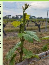
"Boutons floraux agglomérés" Gamay

Le stade "4 à 5 feuilles étalées/ boutons floraux agglomérés" est atteint dans la majorité des situations. Les parcelles les plus tardives sont au stade "2 à 3 feuilles étalées" et les plus avancées sont au stade "5 à 6 feuilles étalées/ boutons floraux agglomérés". Les stades restent hétérogènes sur certaines parcelles.