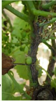
Excoriose sur rameau de l'année

Des symptômes sont signalés sur Gamay, Loin de l'oeil, Syrah et Fer servadou.