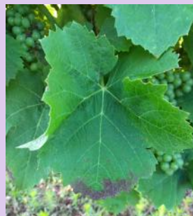
Symptômes de grillures, Fer servadou

A ce jour, les populations larvaires restent en dessous du seuil de risque.