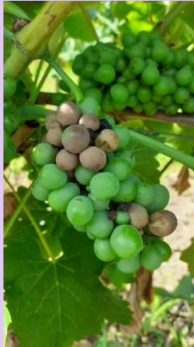
Black-rot sur grappes.

En présence de symptômes sur grappes, restez vigilants jusqu'à "véraison", des repiquages sont possibles de proche en proche.