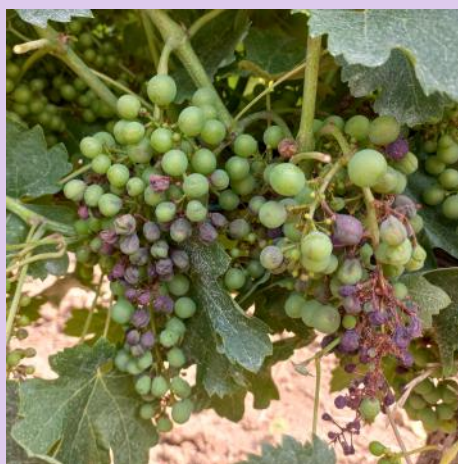
Mildiou sur grappe, Merlot (Ph : CA81).

Les sorties de symptômes s'enchaînent rapidement suite aux différents épisodes pluvieux et phases de repiquages. Il est important de maintenir la protection jusqu'à "véraison".