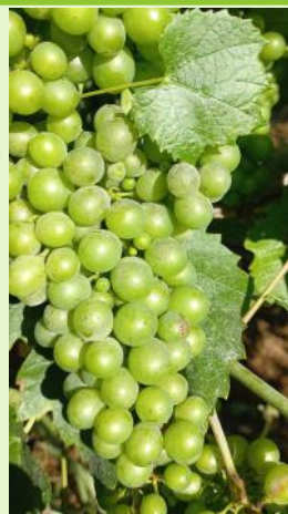
Oïdium sur grappe, Gamay

La phase de sensibilité est toujours en cours. Un risque de contamination est possible jusqu'à "fermeture complète des grappes".