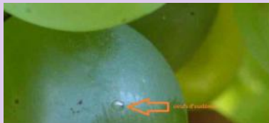
Ponte d'eudemis