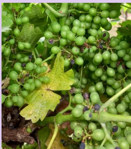
Black-rot sur grappes, symptômes anciens.

A partir du stade "fermeture de la grappe" la sensibilité des baies diminue. Toutefois, en présence de symptômes sur grappes, restez vigilants jusqu'à la "véraison", des repiquages sont possibles de proche en proche.