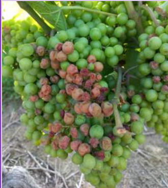
Echaudage sur Gamay, (Ph: CA 81).

Echaudage: Suite aux fortes chaleurs de ces derniers jours, des symptômes d'échaudage sont signalés.