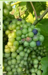
"Premiers grains vérés", Gamay, Ph CA81)