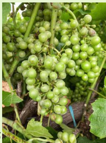
Oïdium sur grappe, Gamay

Sur les parcelles saines, la phase de sensibilité est terminée. Sur les parcelles atteintes, restez vigilants jusqu'à la "véraison".