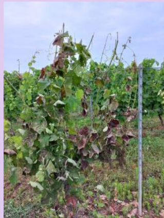
Apoplexie, Fer servadou.

Les symptômes d'apoplexie sont nombreux.