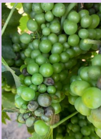
Mildiou, rot-brun sur une grappe de Gamay, (Ph : CA81).

Les symptômes sur feuilles et sur grappes sont fortement présents sur les parcelles, il est important de maintenir la protection jusqu'à la "véraison".