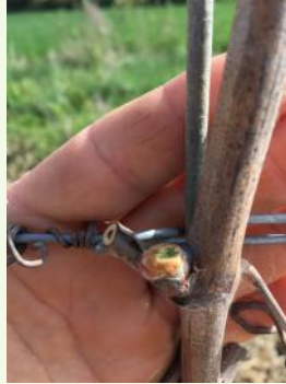
"Mange-bourgeon", dégât et chenille

Le phosphate de fer est une solution de biocontrôle.