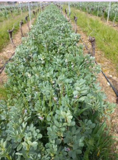
Féveroles au stade optimum pour la destruction.

Attention, une hauteur de végétation excessive dans les parcelles, augmente les effets du gel.