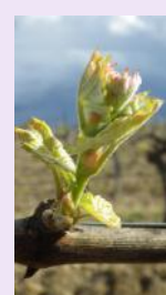
Stade E ou 9.