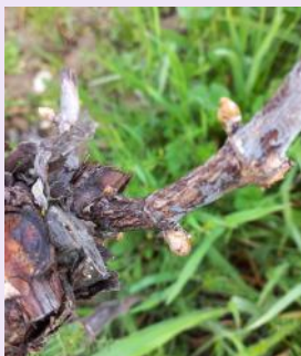
Symptômes en hiver.