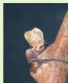
Bourgeon dans le coton - IFV

Les stades les plus fréquemment observés sur le vignoble s'échelonnent entre "bourgeon dans le coton" et "pointe verte" pour les situations de Gamay et Loin de l'œil les plus précoces, voire éclatement des bourgeons/sortie des feuilles pour les bourgeons les plus avancés.