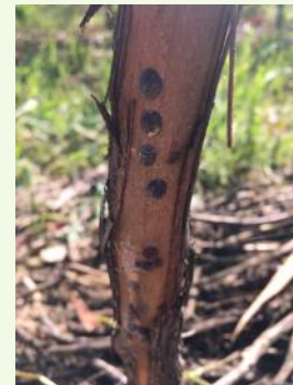
Cochenille lecanine