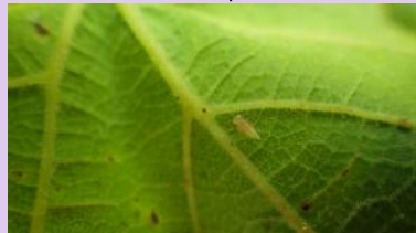
Larve de cicadelle verte

Le seuil d'intervention est de 100 larves pour 100 feuilles.