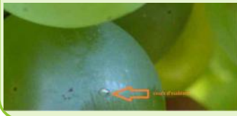
Oeuf de vers de la grappe

(Avec confusion sexuelle: 5 à 10 inflorescences avec au moins un glomérule pour 100 inflorescences).