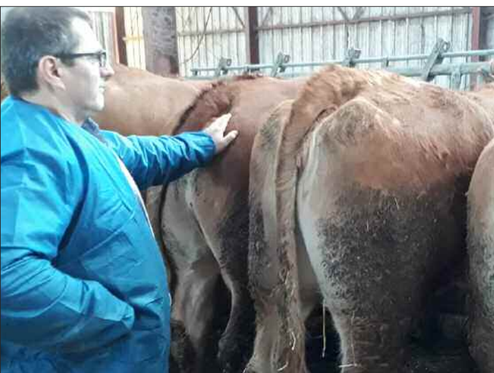
L'observation de l'état du troupeau.

Pour plus d'informations, contactez la Maison de l'élevage : 05 63 48 83 17.