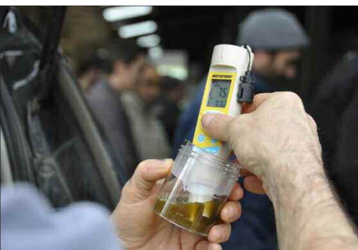
Mesure du pH urinaire.