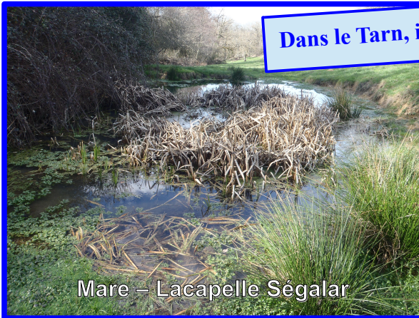
Mare – Lacapelle Ségalar

Dans le Tarn, il existe une grande variété de zones humides.