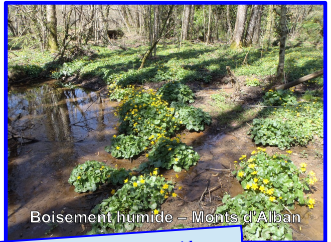
Boisement humide – Monts d'Alban

A la faveur d'une pente, d'un bas fond, là où l'eau se concentre et séjourne ... la végétation change. Le plus souvent, les touffes de joncs révèlent la présence de l'eau dans le sol ; les carex, la menthe aquatique, la renoncule sont autant de plantes indicatrices. Les zones humides prennent aussi l'aspect d'une zone boisée de saules et de frênes (à ne pas confondre avec la ripisylve qui borde les ruisseaux) ; on parle alors de boisement humide.