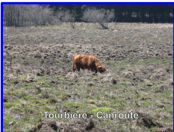
Tourbière - Canroute

A l'interface entre la terre et l'eau, une zone humide se caractérise également par un sol gorgé d'eau (sol hydromorphe). Ce dernier présente alors des traces du passage temporaire ou permanent de l'eau : les traits d'hydromorphie (tâches de rouille pour les engorgements temporaires, bleuâtre/grisâtre pour les engorgements permanents ou quasi-permanents)