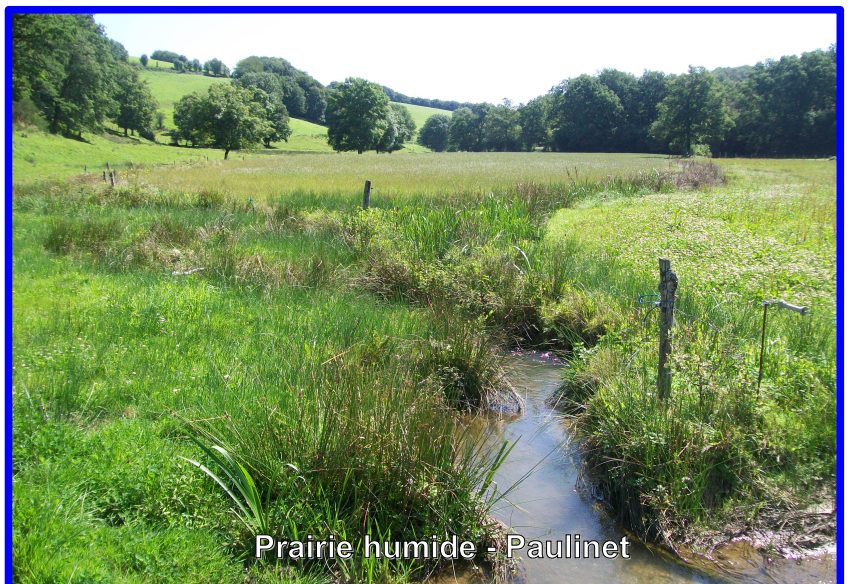
Prairie humide - Paulinet