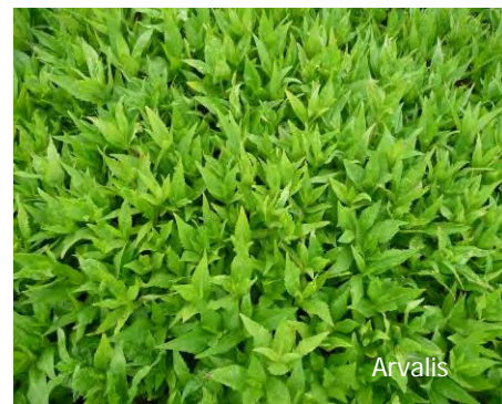
Nyger : adapté au semis de juillet

Les semis sous couvert permettent d'éviter une période pendant laquelle la terre est nue et, donc, la levée d'adventices. Cette technique présente beaucoup d'avantages. Malheureusement peu d'espèces sont adaptées à ce type de semis. En effet, seules les espèces à développement lent et qui ne montent pas dans la culture sont adaptées. De plus, ce type de semis n'est possible que pour des espèces à petites graines qui n'ont pas besoin d'être enfouies