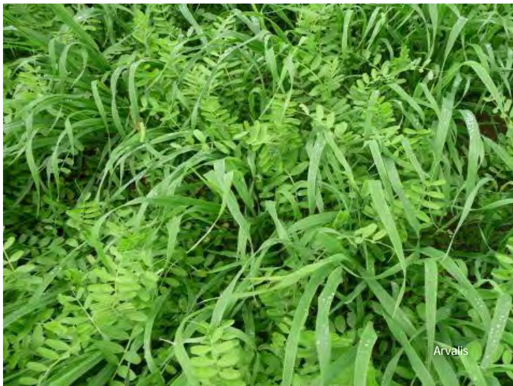
Avoine, vesce : piègeage et fourniture d'azote + bonne couverture du sol

Les mélanges permettent de répondre à plusieurs objectifs en même temps. A chacun d'adapter et de créer le mélange en accord avec ses objectifs.