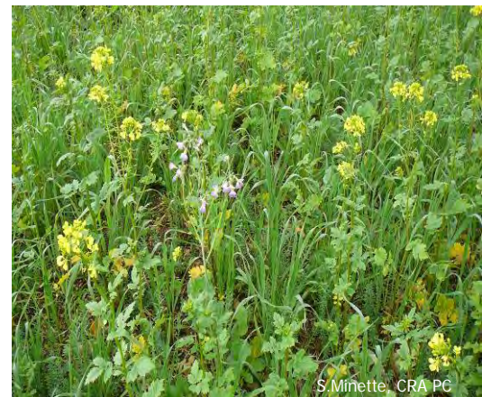
Moutarde, radis, lin, vesce, tournesol

Le développement de la biomasse racinaire, moins important chez les plantes annuelles, est en adéquation avec la biomasse aérienne. Pour les