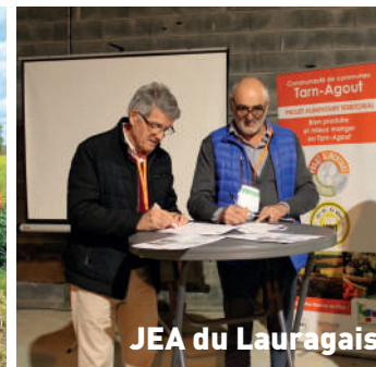
JEA du Lauragais