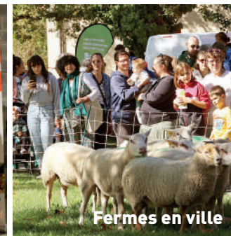
Fermes en ville