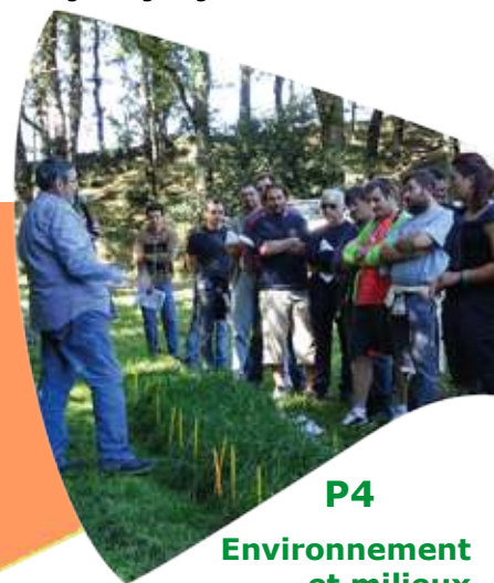
P4 Environnement et milieu